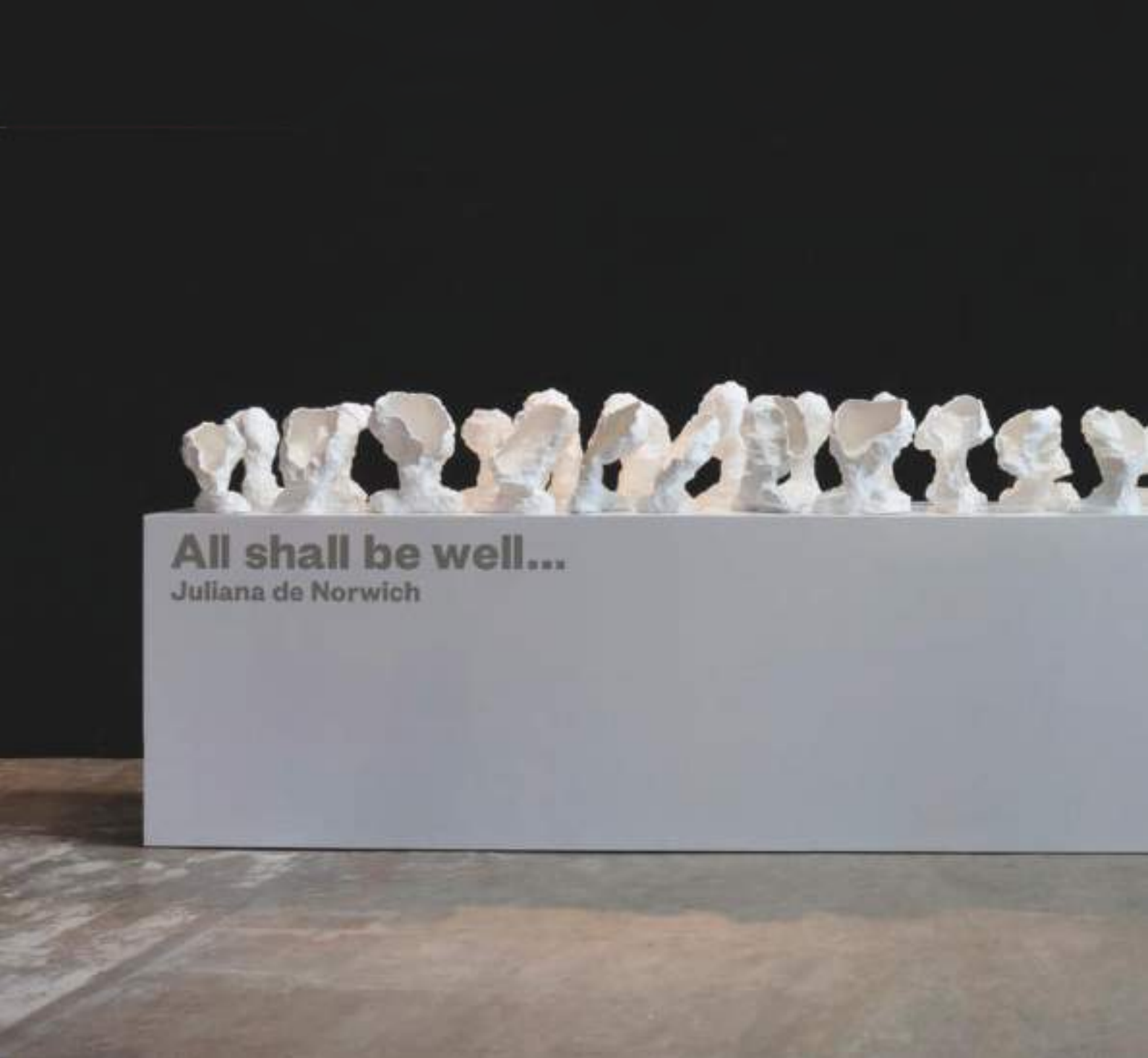
60 sculptures, porcelaine coulée Environ 30 cm de haut chacune