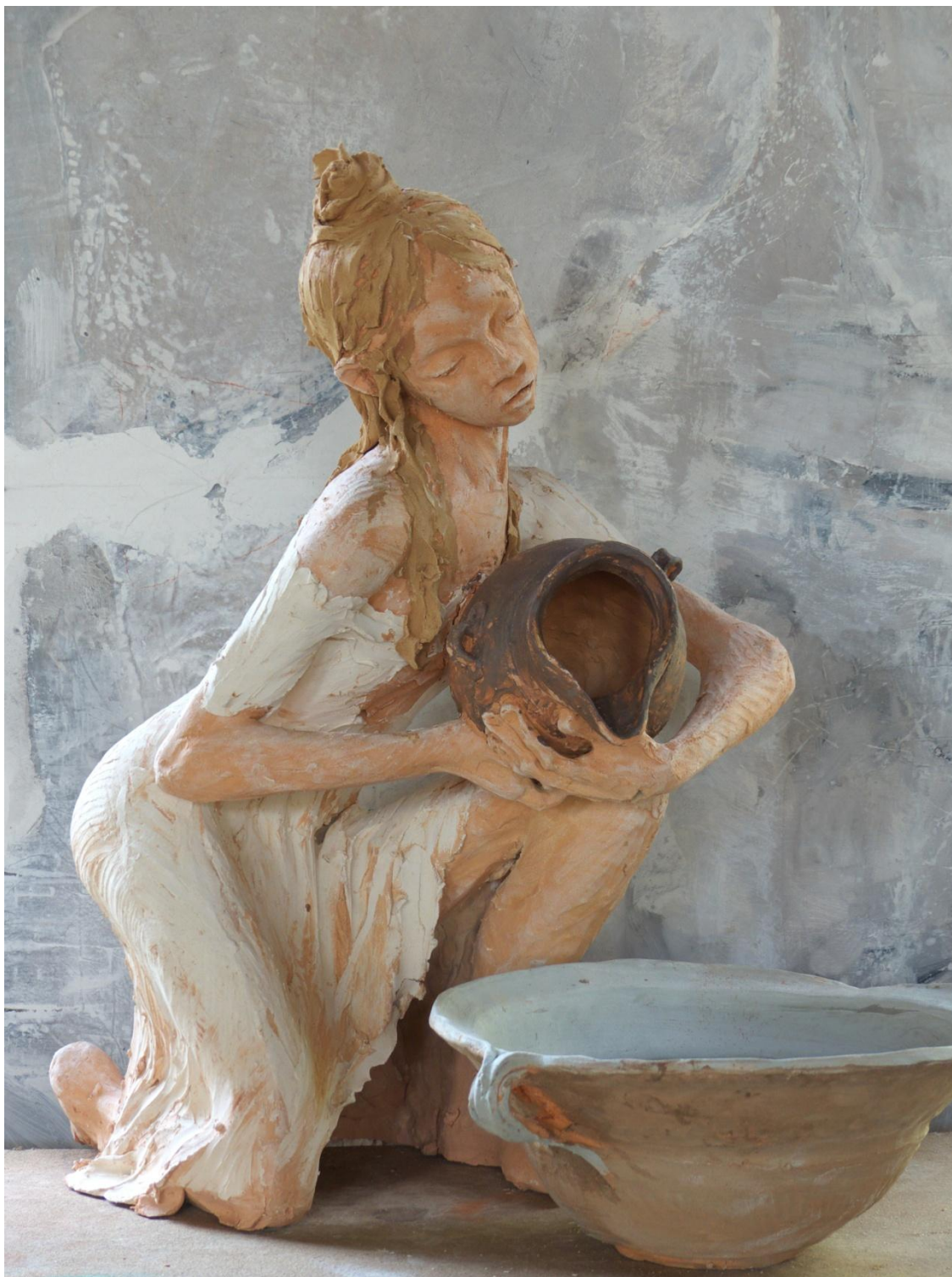
Fille à la cruche Terre cuite 74 x 40 x 40 cm ©Yves Le Gall