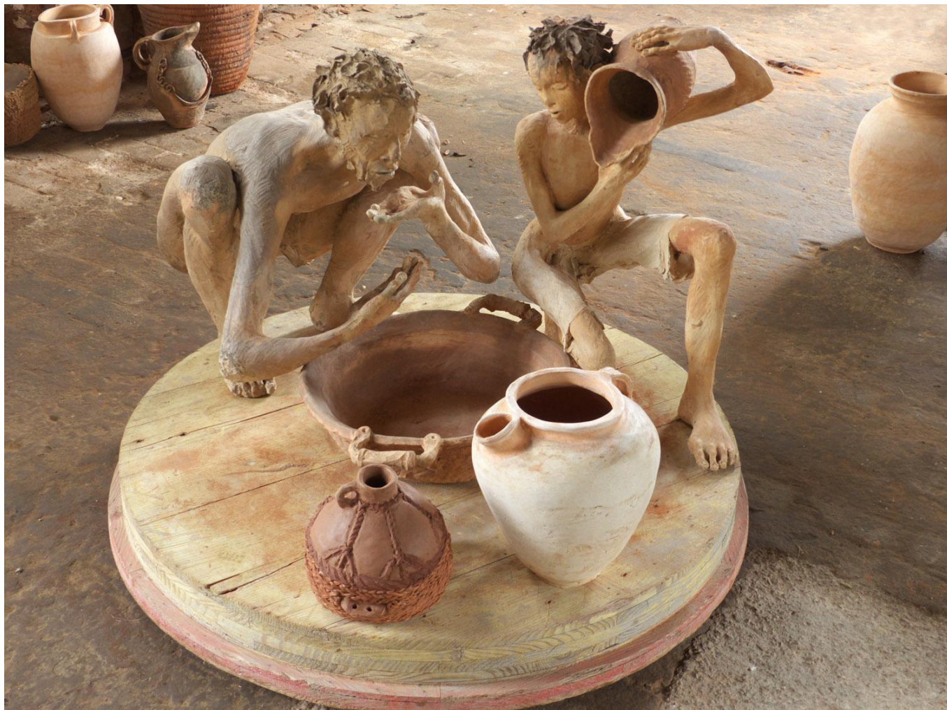
Homme s'abreuvant et enfant à la cruche Terre cuite 80 x 82 x 79 cm / 80 x 50 x 42 cm

« Ce que j'aime, ce sont les humains, à travers la planète, dans la nature. Je ne cherche pas à faire des personnages tristes, mais ils sont graves, pas rigolards c'est sûr. Je les travaille comme les humains. Ils sont pleins de défauts anatomiques. L'important pour moi, c'est de sentir qu'ils existent. »