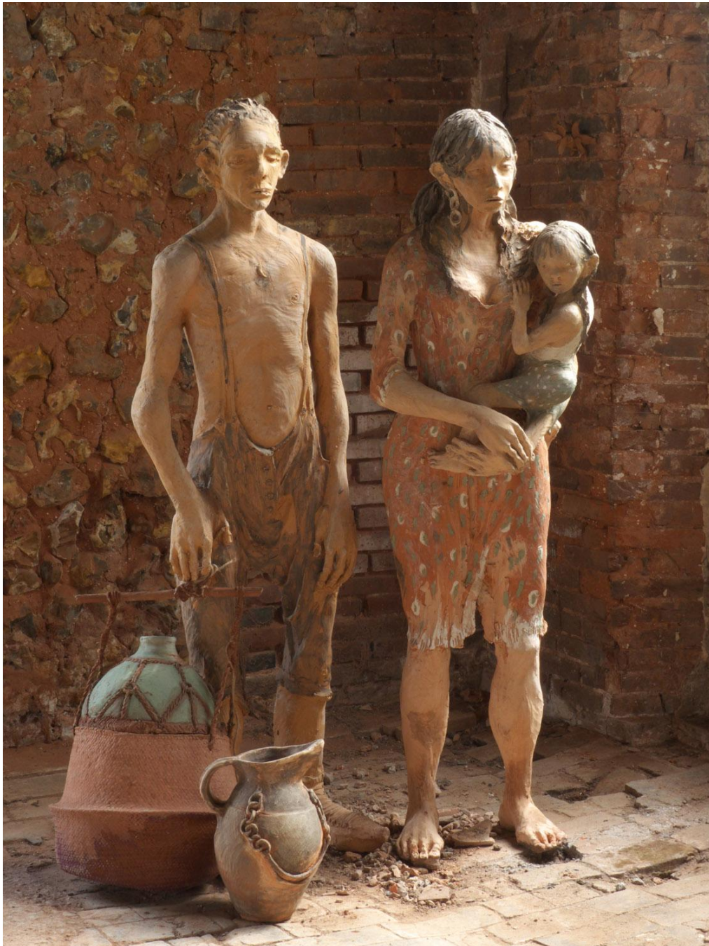
Jeune couple Terre cuite 169 x 67 x 50 cm / 157 x 50 x 40 cm ©Yves Le Gall

EXPOSITION AU CHÂTEAU D'EAU - CHÂTEAU D'ART DE BOURGES 9 JUIN – 23 SEPTEMBRE 2018