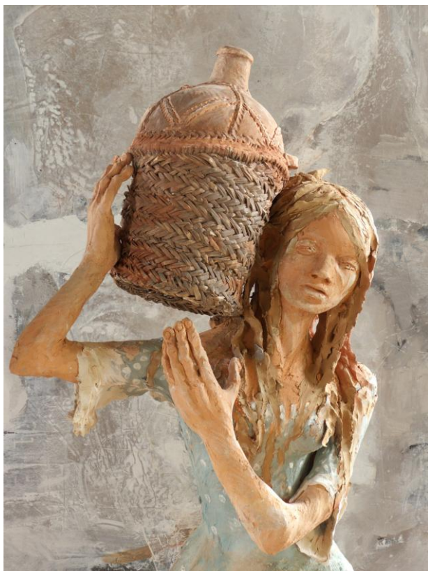
Porteuse d'eau Terre cuite 67 x 65 x 41 cm ©Yves Le Gall