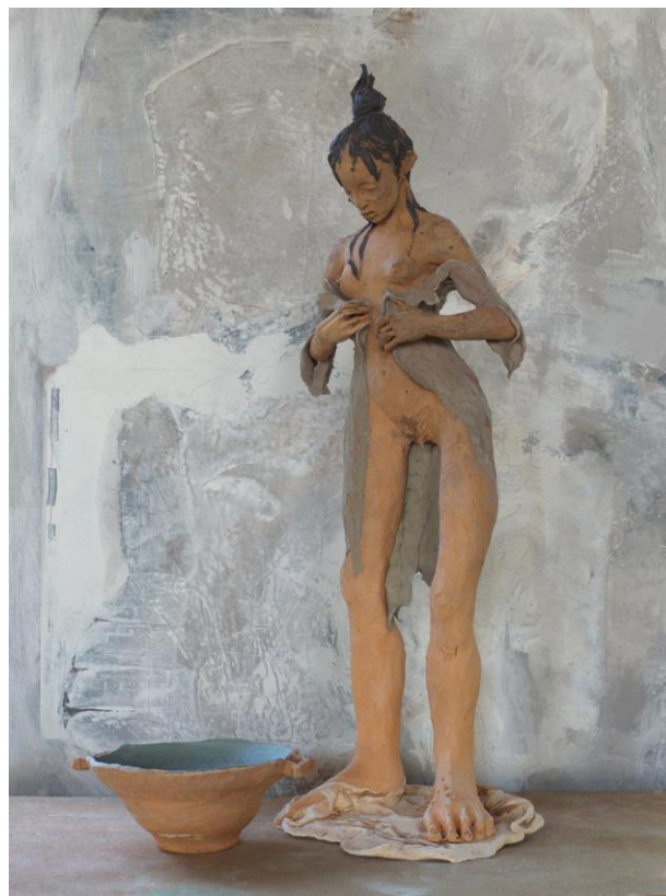
Sortie de bain Terre cuite 79 x 30 x 25 cm ©Yves Le Gall