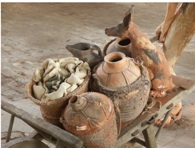
Homme à la brouette (détail)