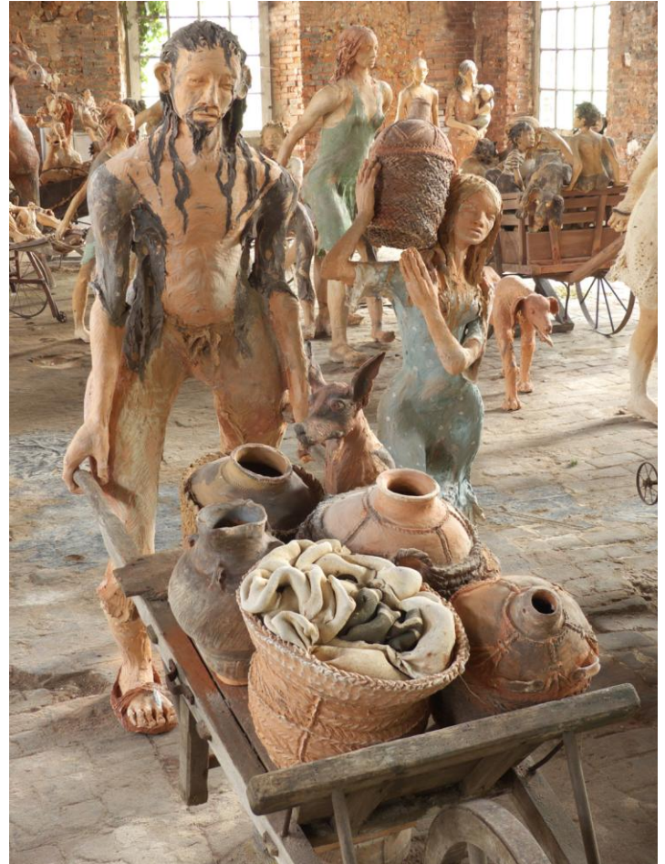
Homme à la brouette Terre cuite 169 x 70 x 210 cm

"Je cherche à ce que les personnages dégagent la vie" dit-elle. Les êtres élancés qu'elle façonne à bras le corps mangent avec leurs doigts et vont nus pieds. Moins par souci de misère que par besoin de liberté : ils célèbrent les mouvements sans entraves et les moments sensuels, embaument le fruit sauvage, le pain chaud et le torrent d'altitude.