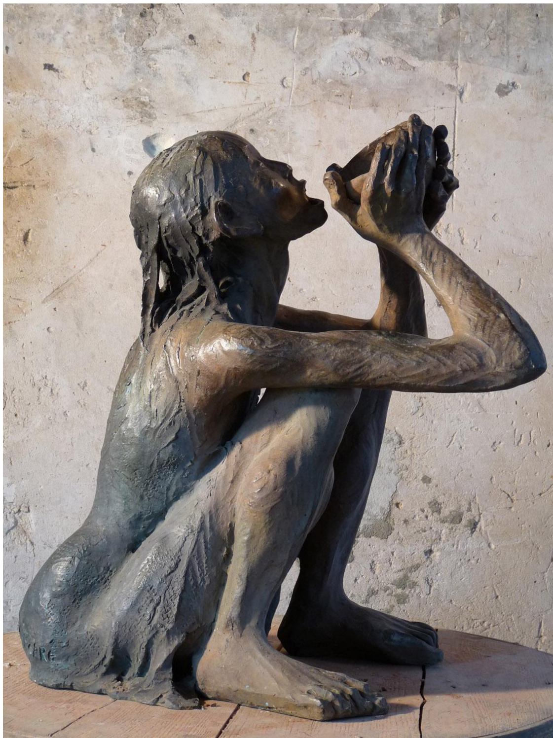
Fille au bol Bronze 60 x 42 x 46 cm ©Yves Le Gall