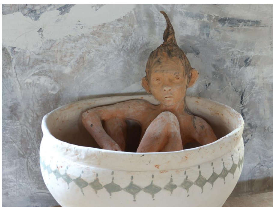
Fillette dans une vasque Terre cuite 60 x 50 x 50 cm ©Yves Le Gall