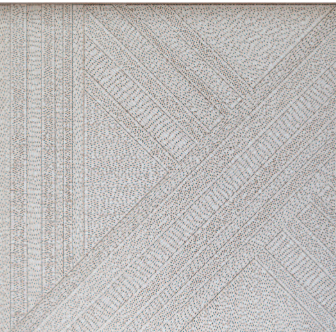
Felipe Gayo Majeur 1 100 x 100 cm peinture-collage