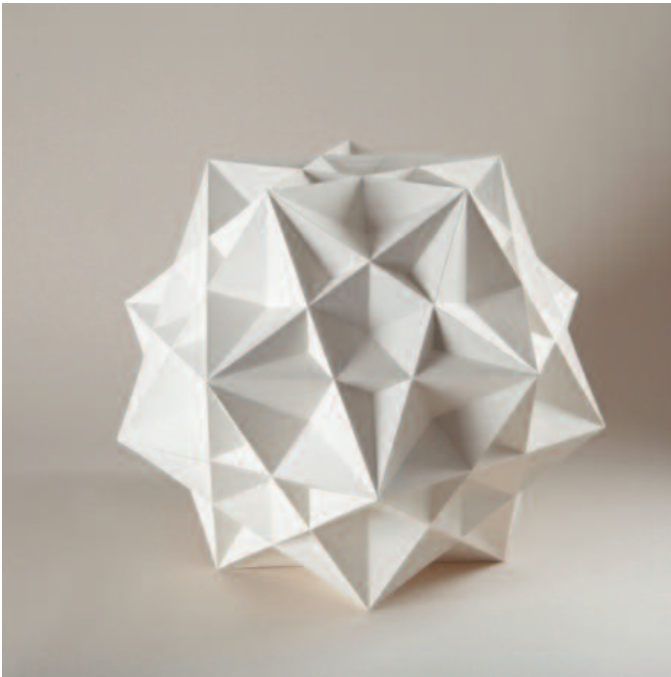
Felipe Gayo Polyèdre 41 x 50 x 50 cm peinture-collage