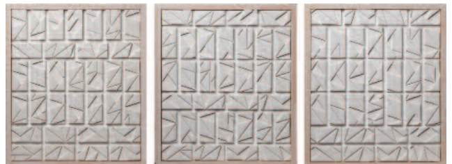
Felipe Gayo Triptyque «Écritures» 3 x 24,5 / 21 cm Cartons biseautés collés sur bois