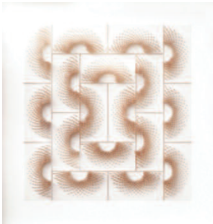
Felipe Gayo SL'O SL'R 81 x 81 cm Peinture et collage

A partir de cette époque, le son, le rythme, les intervalles, les silences se métamorphosent en clartés, lueurs, blancheurs, particules et c'est ainsi que la géométrie devient le véhicule de son étonnement. Il tente d'extraire les mystères de la matière, patiemment et avec passion. Son art est peut-être du côté de cette littéralité, de cette algèbre, de cette abstraction sensuelle chères à Roland Barthes. Ses matériaux sont le bois, le carton, les enduits et les blancs acryliques.