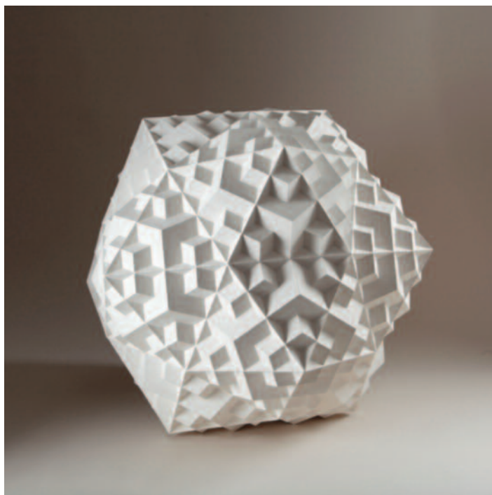
Polyèdre, 60 x 58 x 60 cm peinture-collage